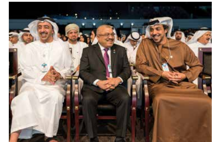
HH Sheikh Abdullah bin Zayed Al Nahyan, HH Lt General Sheikh Saif bin Zayed Al Nahyan with delegates at the World Government Summit.

وقال: "ستصبح معظم مهارتنا عديمة النفع بوجود الأتمتة. وسنشهد إخفاقات كثيرة بسبب حلول الذكاء الاصطناعي محل العديد من الوظائف الروتينية والمناصب الإدارية".