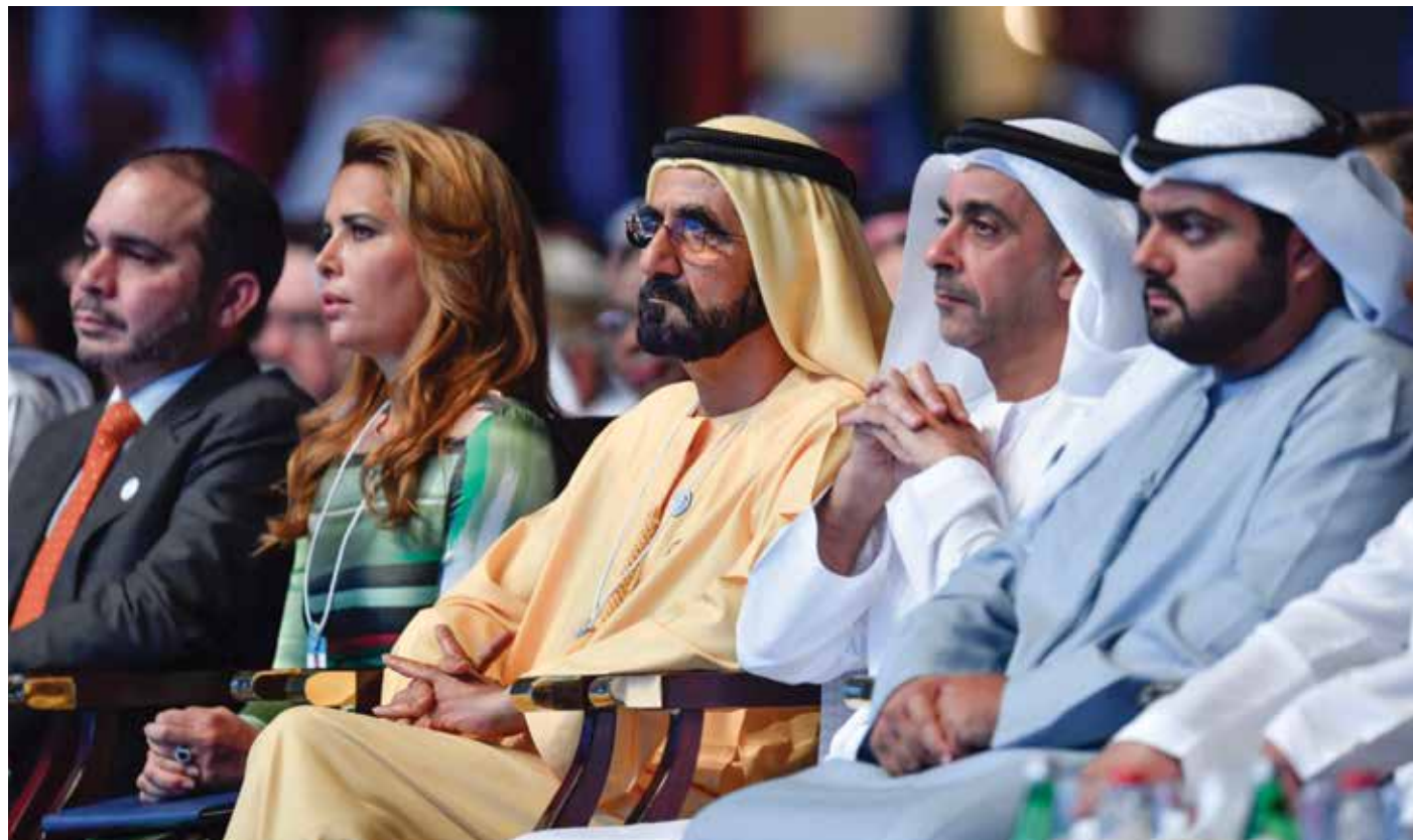
HH Sheikh Mohammed bin Rashid Al Maktoum, UAE Vice President and Prime Minister and Ruler of Dubai with his wife, HRH Princess Haya Bint Al Hussein, HH Lt General Sheikh Saif bin Zayed Al Nahyan, UAE Deputy Prime Minister and Minister of Interior, HH Sheikh Mohammed bin Hamad bin Mohammed Al Sharqi, Crown Prince of Fujairah and HRH Prince Ali bin Hussein of Jordan attended the World Government Summit in Dubai.

ومع اقتراب إسدال الستار على أعمال القمة، أعلن معالي محمد عبدالله القرقاوي، وزير شؤون مجلس الوزراء والمستقبل أن الدورة التالية ستعقد من 17 إلى 19 فبراير 2019. وأوضح القرقاوي الذي تولى أيضاً رئاسة القمة العالمية للحكومات إن الدورة السادسة شهدت إبرام أكبر عدد من الاتفاقيات الدولية لإعادة رسم المستقبل، وأن المناسبة أصبحت في غضون ستة أعوام فقط أضخم تجمع من نوعه في العالم. ☐