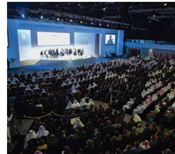
The World Government Summit was held in Dubai in February 2018.