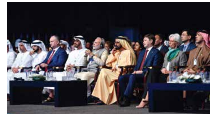
HH Sheikh Mohammed bin Rashid Al Maktoum, HE Narendra Modi Prime Minister of India, HH General Sheikh Mohammed bin Zayed Al Nahyan Crown Prince of Abu Dhabi Deputy Supreme Commander of the UAE Armed Forces, HE Igor Dodon, President of Moldova, and HH Sheikh Hamdan bin Mohamed Al Maktoum, Crown Prince of Dubai, HH Sheikh Mansour bin Zayed Al Nahyan, Christine Lagarde and HE Sapar Isakov, Prime Minister of Kyrgyzstan listen to a speech during the World Government Summit.