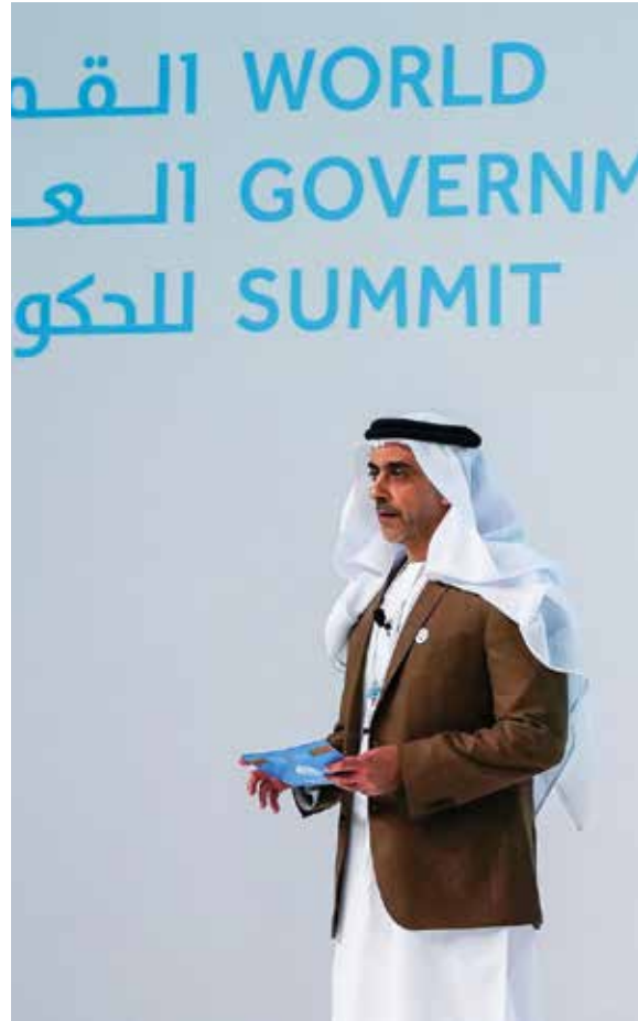
HH Lt General Sheikh Saif bin Zayed Al Nahyan, UAE Deputy Prime Minister and Minister of Interior speaking at the World Government Summit.

وإلى ذلك، فقد أعرب كلاوس شواب، رئيس المنتدى الاقتصادي العالمي ومؤسسه عن ثقته بوتيرة التطورات الحالية قائلاً: "لم يكن التغيير سريعاً مثلما هو عليه حالياً في 2018، ولكن سرعته ستزداد في المستقبل. وعلينا أن نتنقل إلى وضع لا يتخلف فيه أحد عن ركب التقدم".