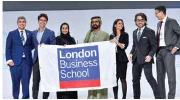
HH Sheikh Mohammed bin Rashid Al Maktoum with London Business School MBA students who were named winners of the Shaping Future Governments Global Universities Challenge in Dubai.

حلولاً ذكية للتحديات العالمية، أكثر من 3 آلاف ترشيح من 77 بلداً.