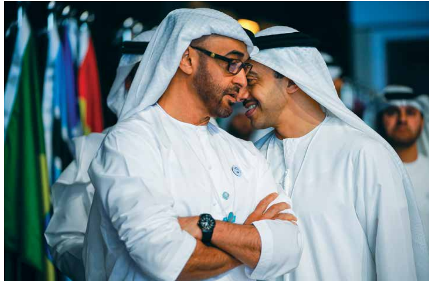
HH General Sheikh Mohammed bin Zayed Al Nahyan, Crown Prince of Abu Dhabi, Deputy Supreme Commander of the UAE Armed Forces and Chairman of the Abu Dhabi Executive Council with HH Sheikh Abdullah bin Zayed Al Nahyan during the World Government Summit held in Dubai in February 2018.

ومن المزمع أن تستضيف الإمارات العربية المتحدة قاعدة دائمة للذكاء الاصطناعي، كما أعطت القمة العالمية للحكومات لمحة عن المشروع من خلال معرض مؤقت عن "متحف المستقبل".