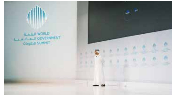
HH Sheikh Abdullah bin Zayed Al Nahyan speaking at the summit.

On the same day, His Highness Sheikh Mohammed bin Rashid Al Maktoum, Vice President and Prime Minister of the UAE and Ruler of Dubai, and His Highness Sheikh Mohammed