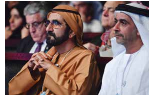
HH Sheikh Mohammed bin Rashid Al Maktoum with HH Lt General Sheikh Saif bin Zayed Al Nahyan.

Bin Zayed Al Nahyan, Abu Dhabi Crown Prince and Deputy Supreme Commander of the UAE Armed Forces welcomed India's Prime Minister Narendra Modi.