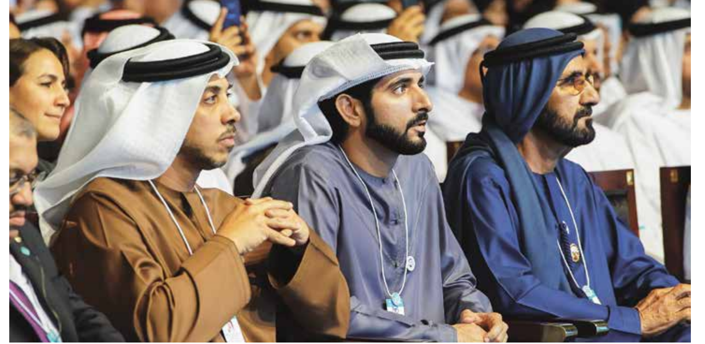
HH Sheikh Mohammed bin Rashid Al Maktoum, UAE Vice President and Prime Minister and Ruler of Dubai, HH Sheikh Hamdan bin Mohammed bin Rashid Al Maktoum, Crown Prince of Dubai, HH Sheikh Mansour bin Zayed Al Nahyan, Deputy Prime Minister and Minister of Presidential Affairs and other delegates at the World Government Summit.

Voicing a similar opinion, Michio Kaku, a theoretical physicist at Futurist City College of New York, said that people are going to digitise all the time and artificial intelligence will do all the tedious work. In the future, contact lenses will offer up