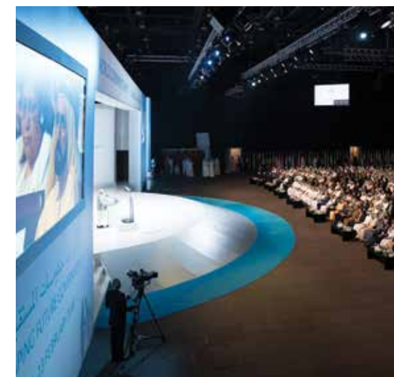
HE Narendra Modi Prime Minister of India, delivers a speech during the 2018 World Government Summit.

a biography of anyone the wearer meets; cars will become robots, helping us select our itineraries; and supersonic jet travel will cut the New York-to-Dubai journey time to two hours. Ultimately, our most complex organ – the brain – will be digitized.