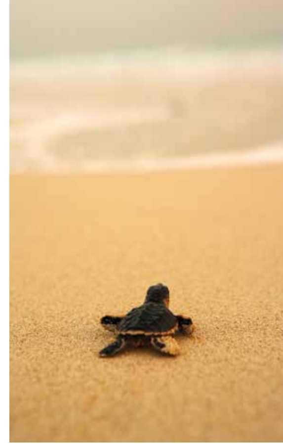
The Hawksbill Sea Turtle Protection Program on Saadiyat Island.

التطوير والاستثمار السياحي، يراقب فريق الخدمات البيئية لدينا بعناية موسم التعشيش لهذه الأنواع المهددة بالانقراض ويطبق بشكل صارم سياسات جديدة لضمان حمايتها. فخلال الموسم هناك قيود على الوصول إلى الشواطئ، كما يتم إطفاء مصابيح الكهرياء ليلاً، ويتم وضع لافتات تحذيرية، وتنفيذ حملة توعية لمنع الزوار من إيذاء الأعشاش حتى يفقس البيض، وهي الفترة التي عادة ما تستغرق 50 إلى 70 يوماً.