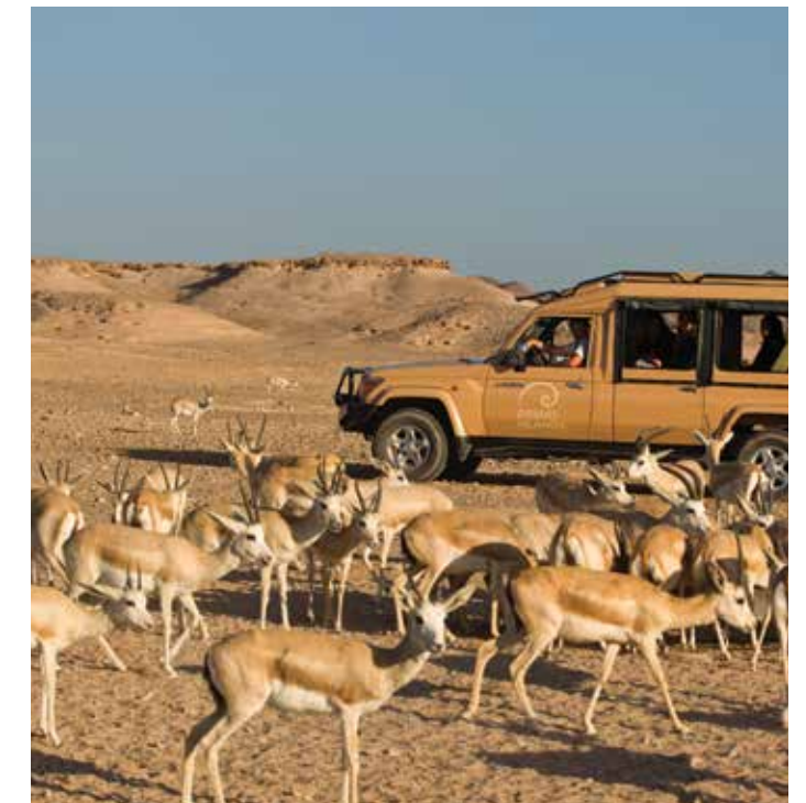
Desert Island Wildlife drive.