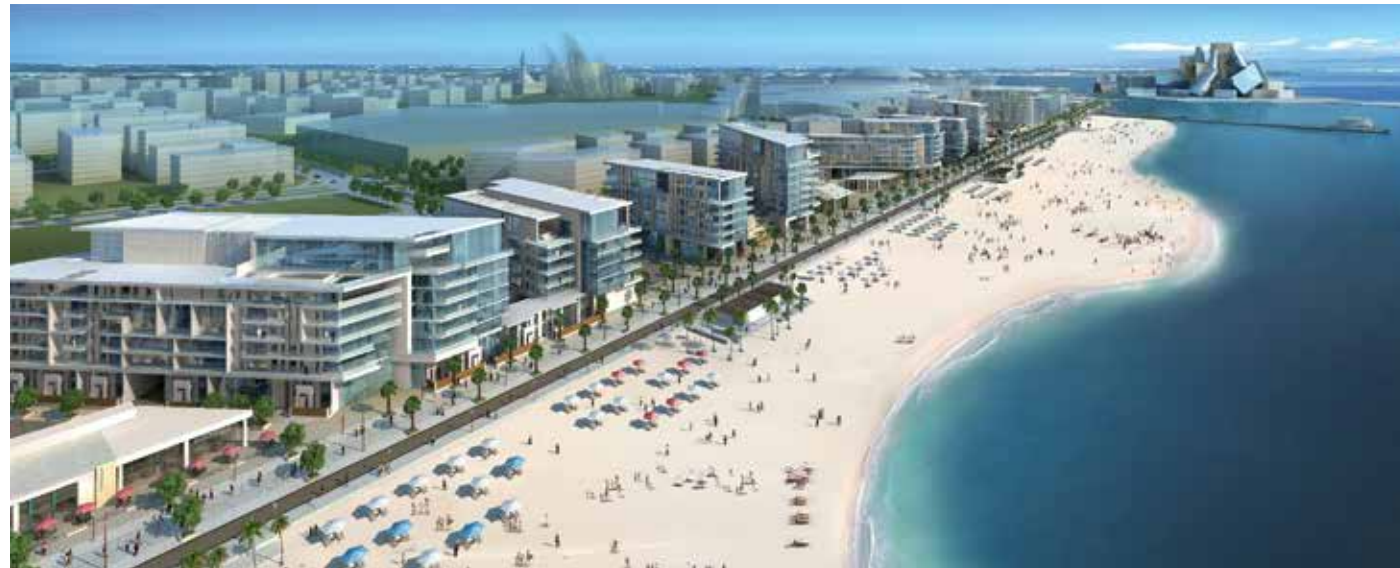
Mamsha Al Saadiyat rendering.

ولا يمكن التقليل من حصرية هذه العروض السكنية، حيث تقع جميعها ضمن مجتمع شامل، يضم على مسافات قريبة كل شيء يحتاجه الزائر من منافذ بيع التجزئة، والمؤسسات التعليمية إلى الشواطئ البكر وحتى محميات الحياة البرية.