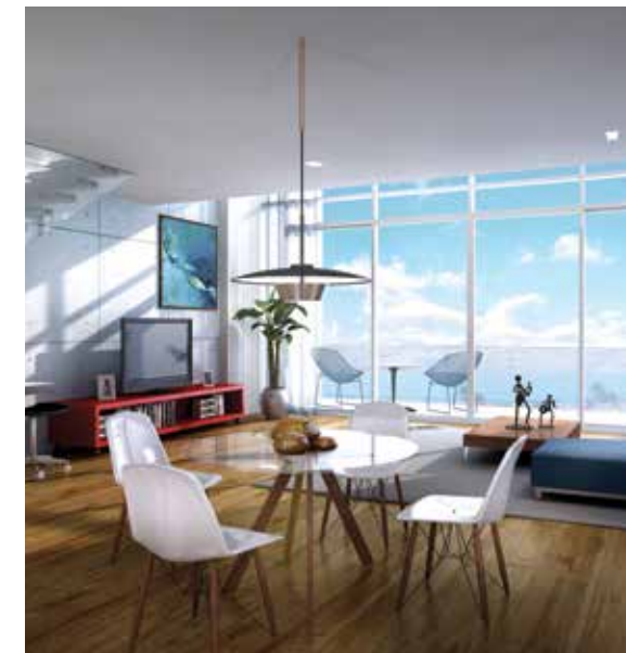
Mamsha Loft lower floor.

في الوقت الذي قمنا فيه بتطوير المخطط الرئيسي للجزيرة، ركزنا على تصميم مجتمع متكامل آخذين بعين الاعتبار متطلبات المقيمين المحتملين والمشاريع التي تتشكل عبر أبوظبي، وما كنا نعتقد أن السياح سيبحثون عنه عند زيارة جزيرة السعديات.