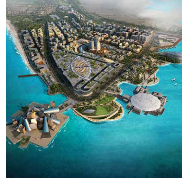
Saadiyat Island view.

Saadiyat Lagoons District, the largest residential development and district on Saadiyat Island, carries with it a nature-based concept that appeals to residents who enjoy the outdoors. This community offers well-appointed, affordable contemporary townhouses and villas, alongside an equestrian center, cycling lanes, running paths and horse trails, as well as easy access to the island's leisure and cultural offerings.