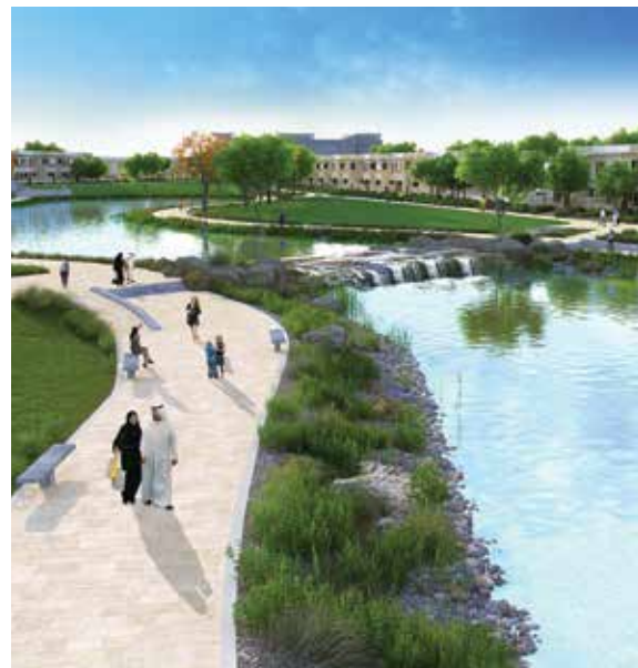
Saadiyat Lagoons rendering.

وكجزء من برنامج حماية السلاحف البحرية التابع لشركة