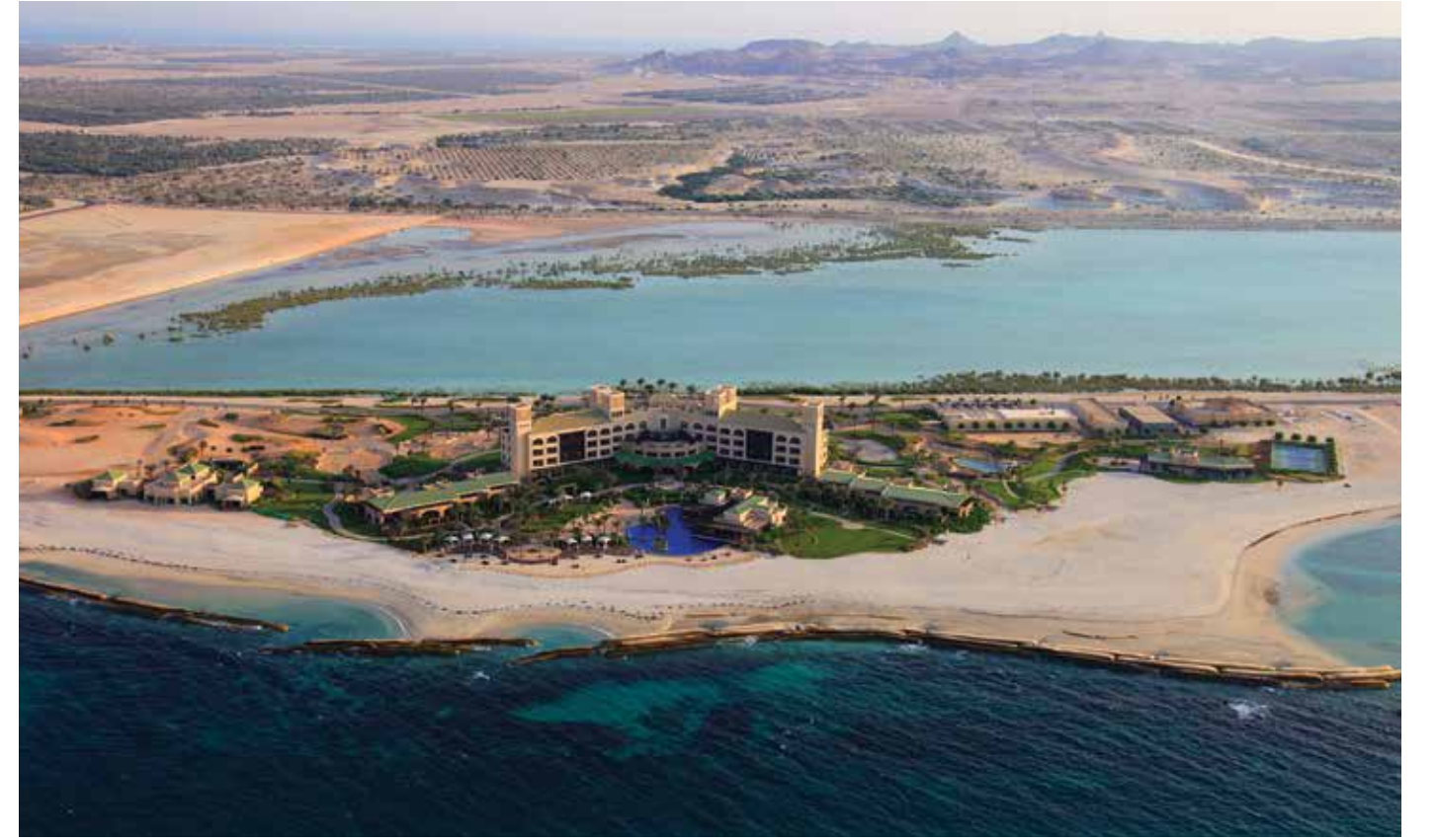
Desert Islands Resort.

The exclusivity of these residential offerings cannot be understated, as they are within an all-inclusive community, which within walking distance contains everything from retail outlets and educational institutions to pristine beaches and wildlife reserves.