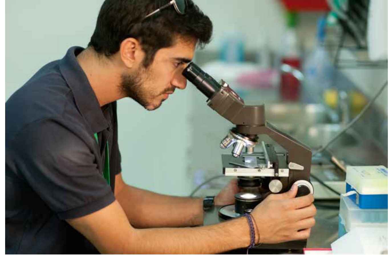
Dr Al Qassimi is one of four National veterinarians in the UAE.

عندنا هذه القدرة، بإمكاننا أن نخاطب الوزارات بشكل رسمي، فالحاجة لتمثيل المهنة حاجة ملحة».