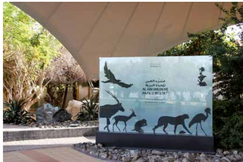
Al Ain Wildlife Park and Resort is an extension of the existing Al Ain Zoo.

which is the honour roll that recognizes a college student for his or her outstanding academic achievement.