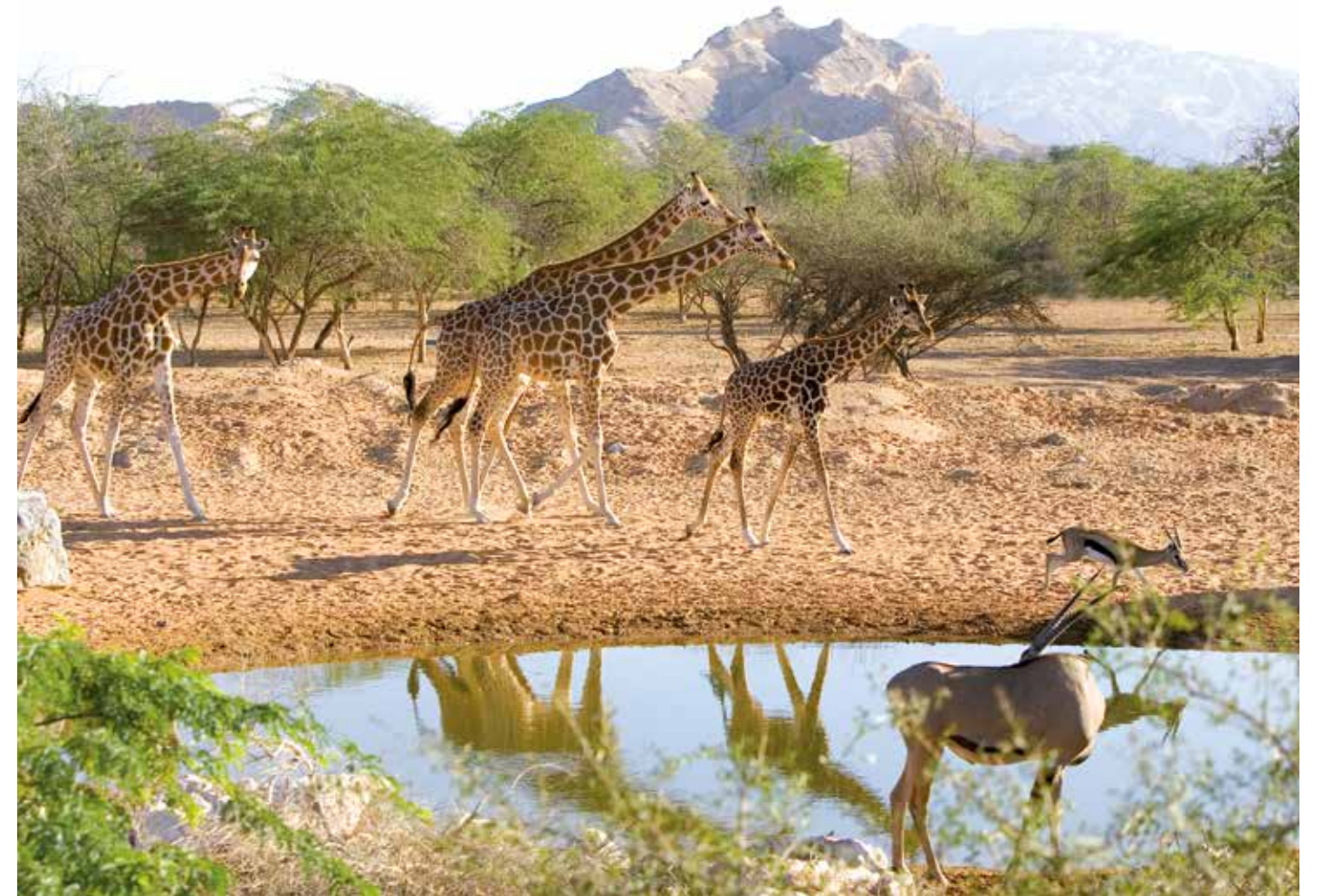
The giraffe enclosure at the Al Ain Zoo.