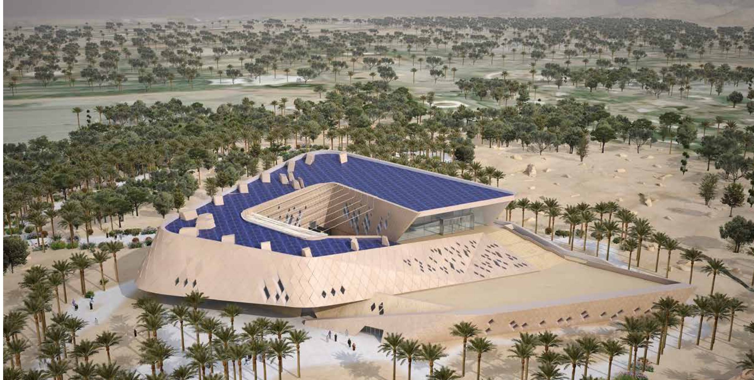
Sheikh Zayed Desert Learning Centre at the Al Ain Zoo.

ونتسوق في المولات. ومن دواعي سعادتني القول إننا عائدون إلى ماضيها. لقد أعادت كثيرٌ من الهيئات البيئية والأقسام الثقافية شبابنا إلى الماضي، وقامت بعمل عملاق للاعتناء والمحافظة على تراثنا الأصيل».