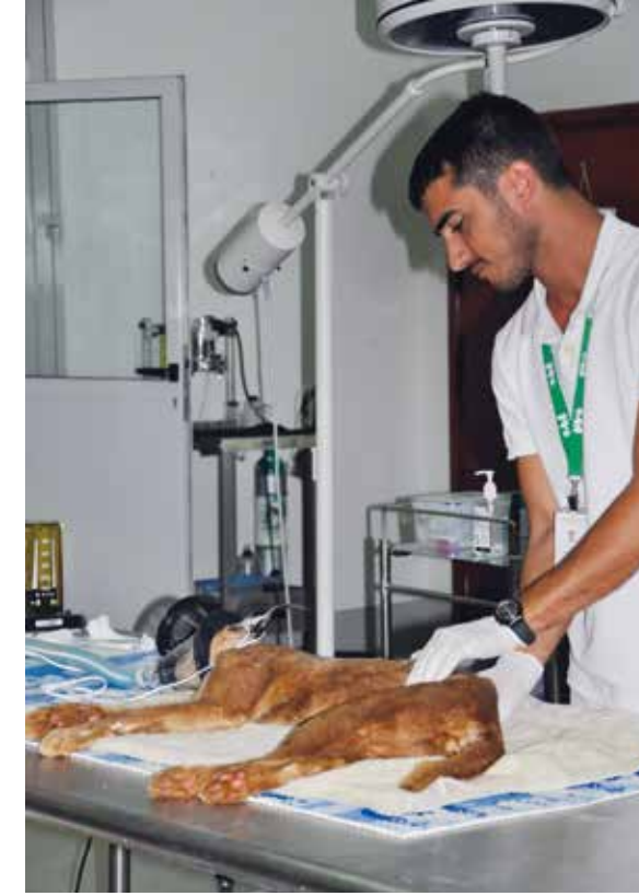
Al Ain Zoo, preparing a caracal for surgery.

يصف الدكتور القاسمي البرنامج الأخير بأنه أوسع شهادة علمية في البلاد، ويتابع: «هي بداية في الاتجاه الصحيح، وأمل أن يكون لي دور فيها مستقبلاً».