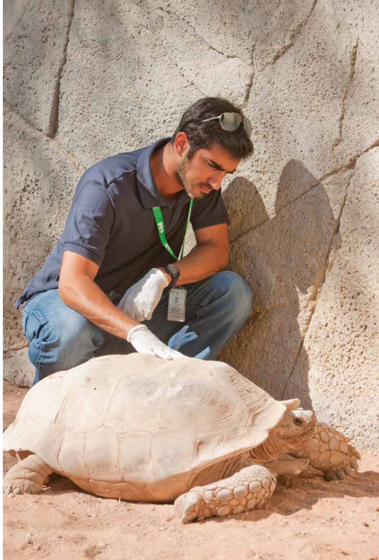
Al Ain Zoo, checking on a Giant tortoise.