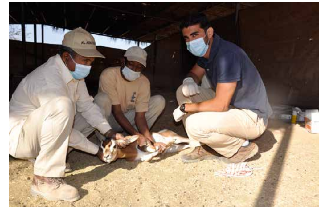
Al Ain Zoo, working with keepers during our routine vaccination of gazelles.

He notes that tourism has sufficiently matured in the UAE to exhibit and showcase the country's history and culture. “I'm seeing more and more young Emiratis who have turned around and incorporated our traditions into their modern practices. My generation faces what I call a culture shock – growing up and trying to find that balance of modernism and heritage, to give our children a solid identity.”