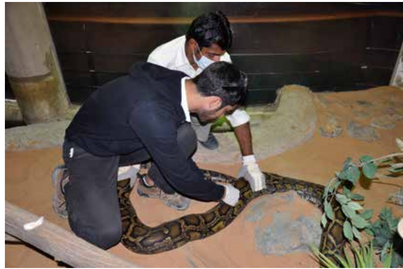
At Al Ain Zoo, administering antibiotics to a python on exhibit during rounds.

«كانت معرفته واسعة وعميقة، وهو لا يزال واحداً من أعلم الناس الذين أعرفهم. أردت أن أصبح مثله، بكل بساطة، لكي أفهم العالم الطبيعي كما يفهمه هو، وأنا مدين له إلى الأبد بتلك الرعاية وذلك التوجيه.»