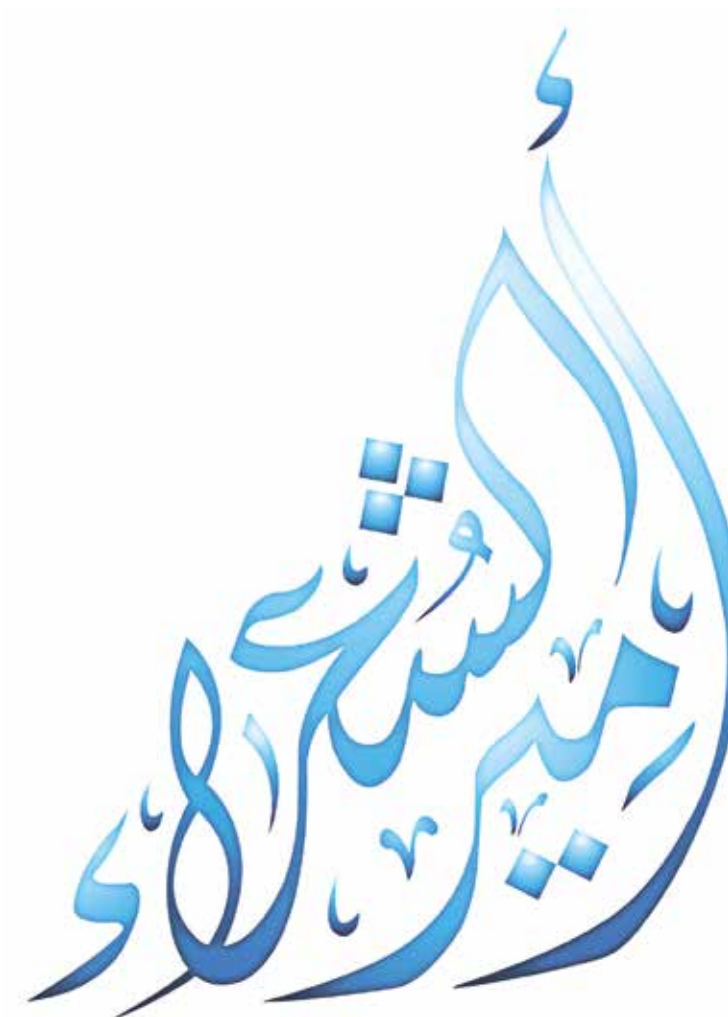
The Million's Poet logo.

وعلاوة على ما تقدم، ستقوم لجنة التحكيم المختصة بدراسة لغة جسد المتسابقين وحركاتهم وحضورهم على المسرح أثناء الحلقات المباشرة، وإخضاعهم لقراءة نفسية معمقة لمعرفة أنماط شخصياتهم، وذلك وفقاً لمعيار جديد تمت إضافته في الموسم الماضي من البرنامج.