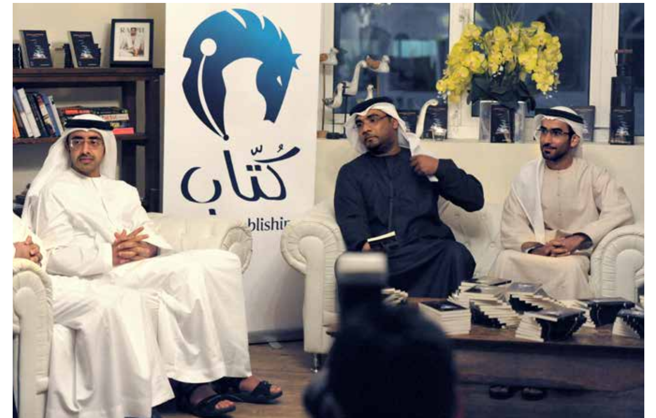
HH Sheikh Abdullah Bin Zayed Al Nahyan, UAE Minister of Foreign Affairs with Jamal Al Shehhi and Sultan Al Amimi.

At its core, the competition is a nostalgic revival of a great literary treasure and one of