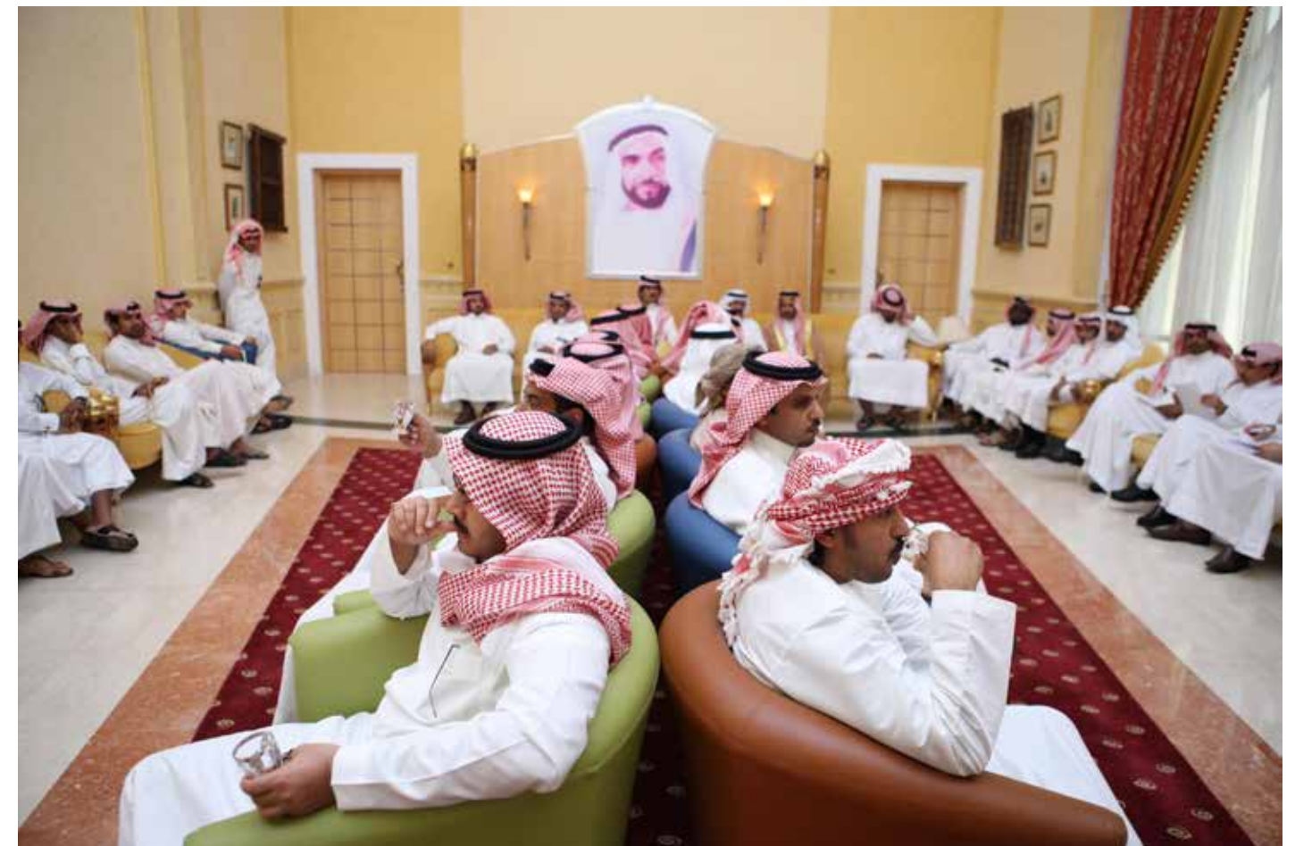
The Million's Poet competition will reveal some of the finest Nabati poets in the Middle East.

In the early days of Million's Poet, the only way viewers could directly engage was by live attendance. But today, multiple channels are available, such as SMS, on-screen chatting and social media, which have made the show more interactive than ever.