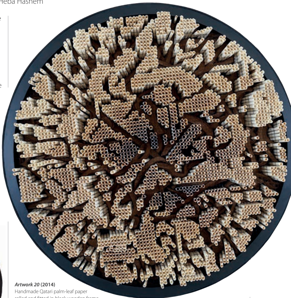
Artwork 20 (2014)

Handmade Qatari palm-leaf paper floating in black frame. 200cm diameter. Private collection.