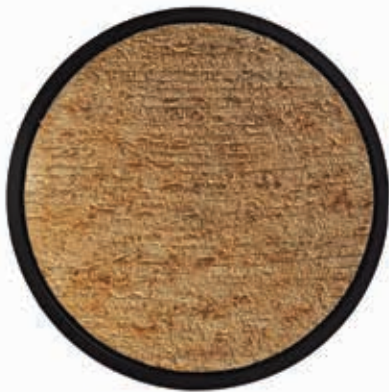
Full-Moon Love Letters (2010)

"I travelled all over the world to find a unique type of handmade paper," he explains. "Then a few years ago, I asked myself, why don't I make my own paper?"