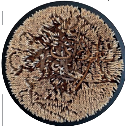
«العمل الفني رقم ٩» (٢٠١٤) ورق مصنوع يدوياً من سفن النخل القطري، ملفوف ومثبت بشبكة معدنية مطلية ضمن إطار خشبي أسود مغطى بغلاف بلاستيكي زجاجي القطر ١٢٠ سم من مقتنيات مؤسسة بارجيل للفنون، الشارقة.

بيعت لوحة الفنان يوسف أحمد «أب» بمبلغ ٦٠ ألف دولار في دار كريستيز في عام ٢٠٠٩، أي أكبر من ضعف سعرها المتوقع حينذاك. وقد رسم يوسف هذه اللوحة على القماش بمزيج من الألوان الزرقاء والبرتقالية لتصوير الحائط القديم في حي «الجسرة» الذي ترعرع فيه الفنان في الدوحة.