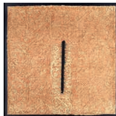
Birth of Innovation (2011)

Handmade Qatari palm-leaf paper rolled and fitted in black wooden frame with coated metal black net covered by Plexiglas. 120cm x 120cm. Private collection.