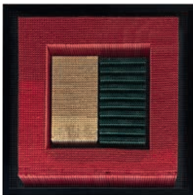
Artwork 49 (2014)

"I am a self-taught calligrapher. I learned through many sources, such as the textbooks of the Iraqi calligraphy master Hashim Baghdadi. I don't stick to the rules, but I also don't ignore them. And I always look for new ways to present the letters' meanings and aesthetics."